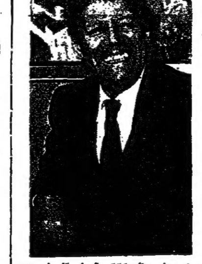
يون حيث يحل ٢٢٤ مقعدا مقابل ٢٢٢ مقعدا في مجلس النواب السابق . وسيفرض الحزب الاشتراكي الديموقراطي الذي يقترعه المستشار الاتاني العربي ملحم شميدت ٤٠ مقعدا اخرى وسيفل في مجلس النواب من قبل ٢١٨ نائبا ، اما الديموقراطيون الاحرار فيحصلون على ١٥ مقعدا اخر وسيملكون في مجلس النواب من قبل ٤٤ نائبا .

وقد من مجلس الاعيان الاراني يزور يوغوسلافيا